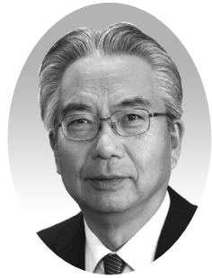
杉浦 辰夫 議員