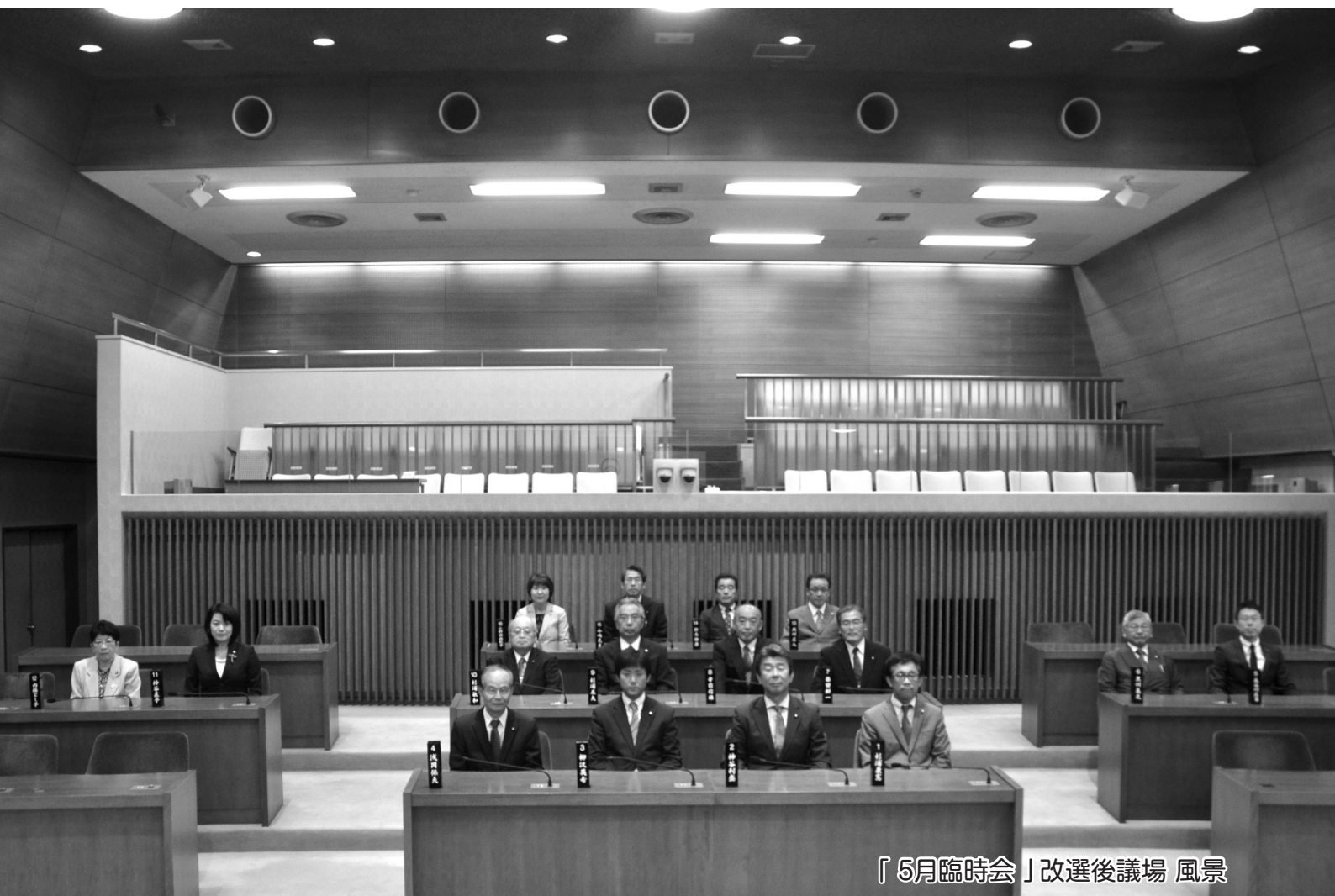
「5月臨時会」改選後議場 風景