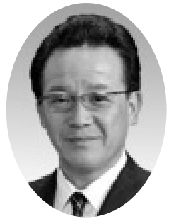
北川 広人 議員

答 業界の皆さまが三州瓦の利用及び普及の促進を図るため、一つの戦略として「瓦サミット」を開催するとの機運が高まり、業界が主体となって取り組むとなった場合には、業界の活動を尊重し支援に努めていきたい。