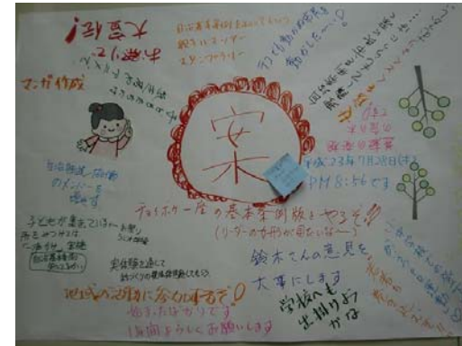
▲自治推進・協働分科会