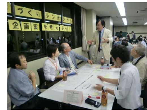
▲第5回「まちづくりシンポジウムの企画案」を考えよう