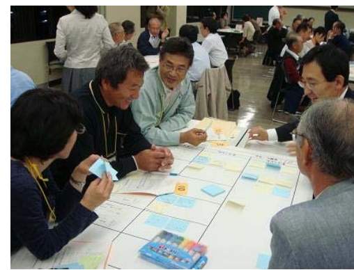
▲第5回「まちづくりシンポジウムの企画案」を考えよう