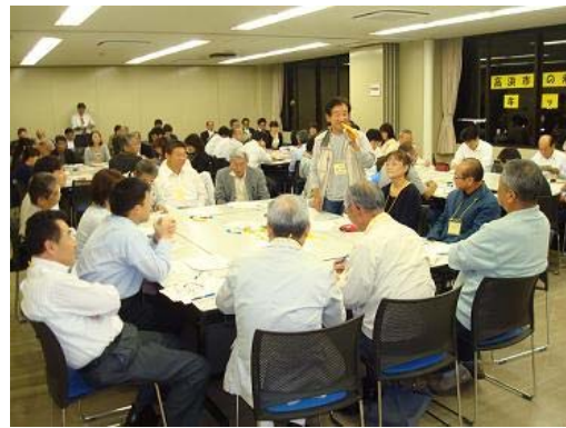
▲第1回(市民会議キックオフ)