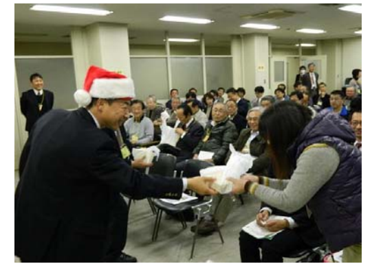
▲第7回(お知らせコーナー)