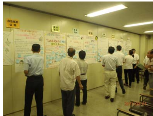
▲第4回(各分科会の実行テーマ発表)