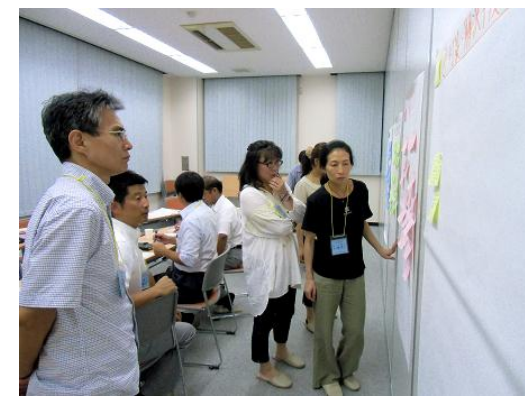
▲学校教育分科会 ポストイットに意見が一杯!