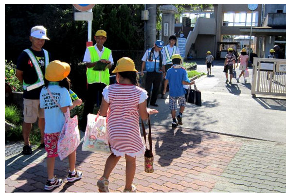
▲防犯・防災分科会 早朝からあいさつの検証