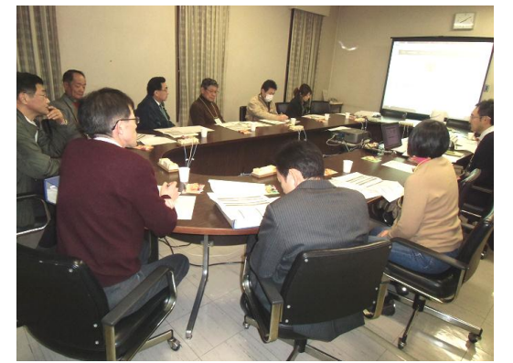
▲生涯学習分科会 先進事例をもとに話し合い