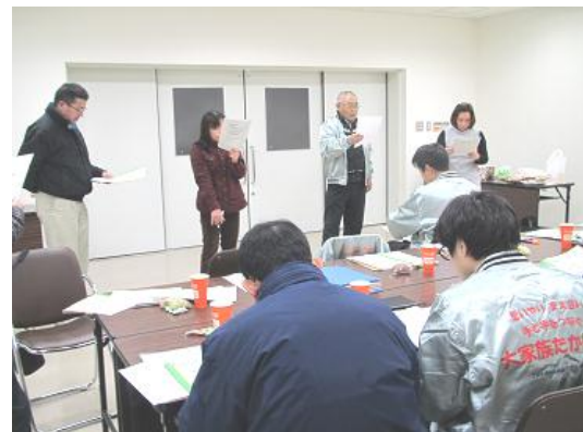
▲自治推進分科会 出前授業の積古本格化!