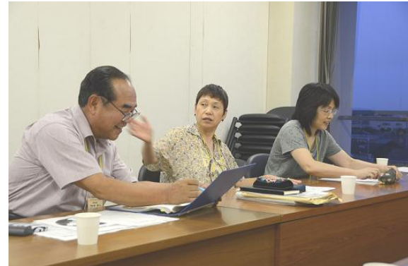
▲財政分科会 女性の意見もしっかり反映