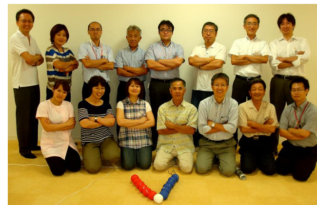
▲地域福祉分科会 チームワーク必須のポッチャ!