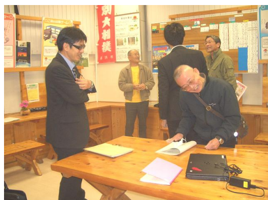
▲環境・憩い分科会 毎月1回エコハウスに集合!