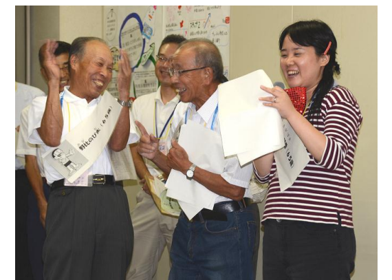
▲健康分科会 健康の究極の秘訣は笑顔