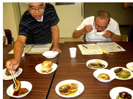
▲産業・観光分科会 高浜野菜の試食に夢中!