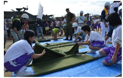
▲総合防災訓練の様子