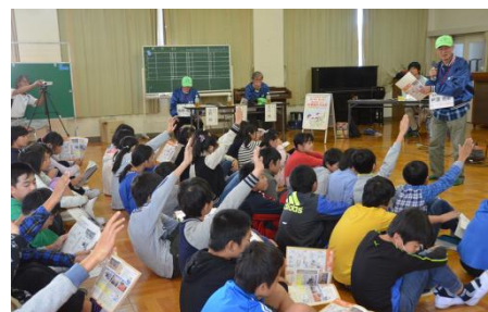
▲自治基本条例 出前授業