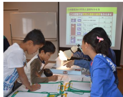
▲環境学習のようす