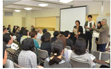
▲タカハマ！まるごと宝箱 (聞き書き冊子「おひろめ会」)