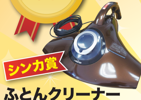
シンカ賞 ふとんクリーナー