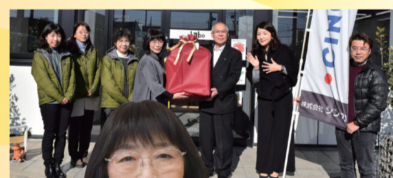
スギヤス賞 フットマッサージャー