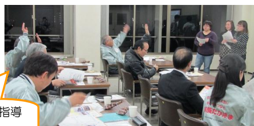
出前授業の練習風景

「高浜（まち）の学校」お試し版では、かわら美術館にて、「親子のための初心者向けデジカメ講座」を開講します！