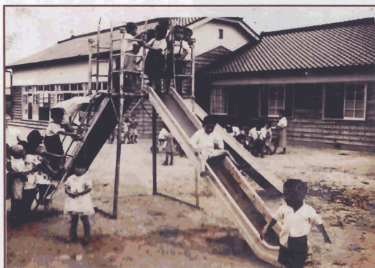
昭和30年頃 吉浜保育園

写真の「吉浜保育園」は小学校の北東にあつて昭和二六年に開園しました。小学校との間にお茶畑があつたこと覚えていますか。当時の園児は現在六十五歳くらいかな。