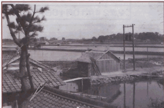
昭和10年頃 吉浜養魚場