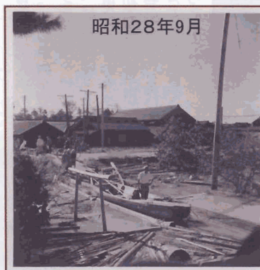
昭和28年9月 台風13号の被害状況

写真の「吉浜保育園」は小学校の北東にあつて昭和二六年に開園しました。小学校との間にお茶畑があつたこと覚えていますか。当時の園児は現在六十五歳くらいかな。