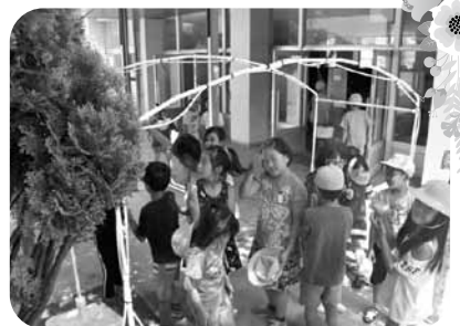
株式会社三洋商店様 ミストシャワーを小中学校にプレゼント