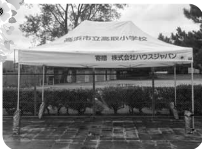
株式会社ハウスジャパン様 小学校へエイジーアップテントの寄附