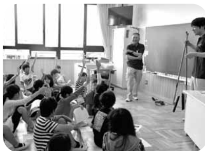
サンエイ株式会社様 高浜小学校へ掃除道具の寄附とお掃除特別授業