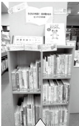
図書館には子どもの本選び、読み聞かせの参考書コーナーもあります!

学校、幼稚園などの読み聞かせボランティアで活躍している方、これから活動したい方におすすめ!初心者にもわかりやすい基礎の話から実践、おすすめ本の紹介など、読み聞かせのスキルアップに繋がる講座です。