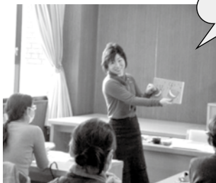
昨年度の講座のようす