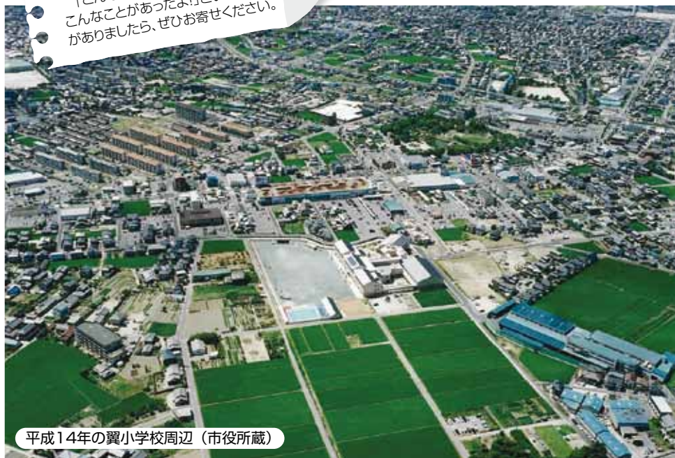
平成14年の翼小学校周辺

市では、これまで高浜が歩んできた歴史や人々の記憶を知り、市の有形・無形の資料を整理して後世へ伝えるとともに、今を生きる私たち、そして将来のまちづくりに活かしていくことを目的として、市民の皆さんの協力を得ながら、新たな「高浜市誌」の編さんを進めています。 タイトルにあるアーカイブとは「記録保管所」という意味です。このコーナーでは、編さん作業の中で掘り起こされた写真や資料などを中心に、まちのこれまでのあゆみや魅力・自慢などを紹介していきます。 「こんなことを知っている!!」「他にもこんなことがあったよ!」といった情報がありましたら、ぜひお寄せください。