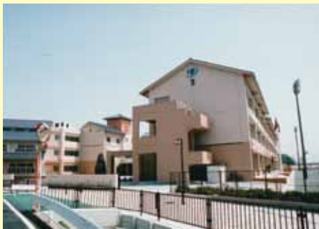
◀開校当時の翼小学校 (市役所蔵)

高浜中部特定土地地区画整理事業(昭和51年度〜平成元年度)や高浜東部土地地区画整理事業(平成5年度〜平成10年度)により、田畑が広がる風景から、住宅や店舗が建ち並び風景へと、まちのようすが大きく変わりました。人口の増加に伴い、吉浜小学校と高取小学校の学級数を適正にするため、平成14年4月1日に翼小学校が開校しました。学校名は公募にて選定し、530件の応募のなかから、小学生が応募した「翼」に決定しました。