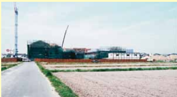
▲建設工事中の翼小学校のようす