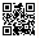
高浜市公式ホームページ

ホームページは「必要書類や持ち物を事前に確認できる」、「記入用紙をダウンロードできる」ようにし、出生・入学・年金など、あなたの人生のさまざまなシーンで必要な手続きをサポートします。