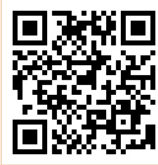
高浜市公式フェイスブック

フェイスブックは「明日はこんなイベントがあります。」「いまこんな行事の真っ最中。まだ間に合います！」など、身近な「今」の情報をお知らせします。