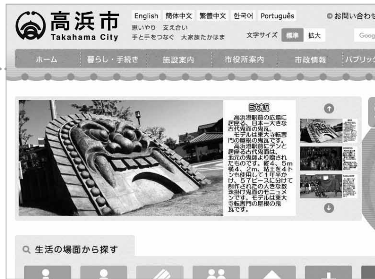
▲パソコン用の画面