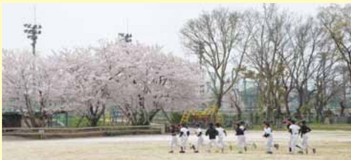
◀高取小学校に移植された「三本桜」（平成27年高浜市役所撮影）