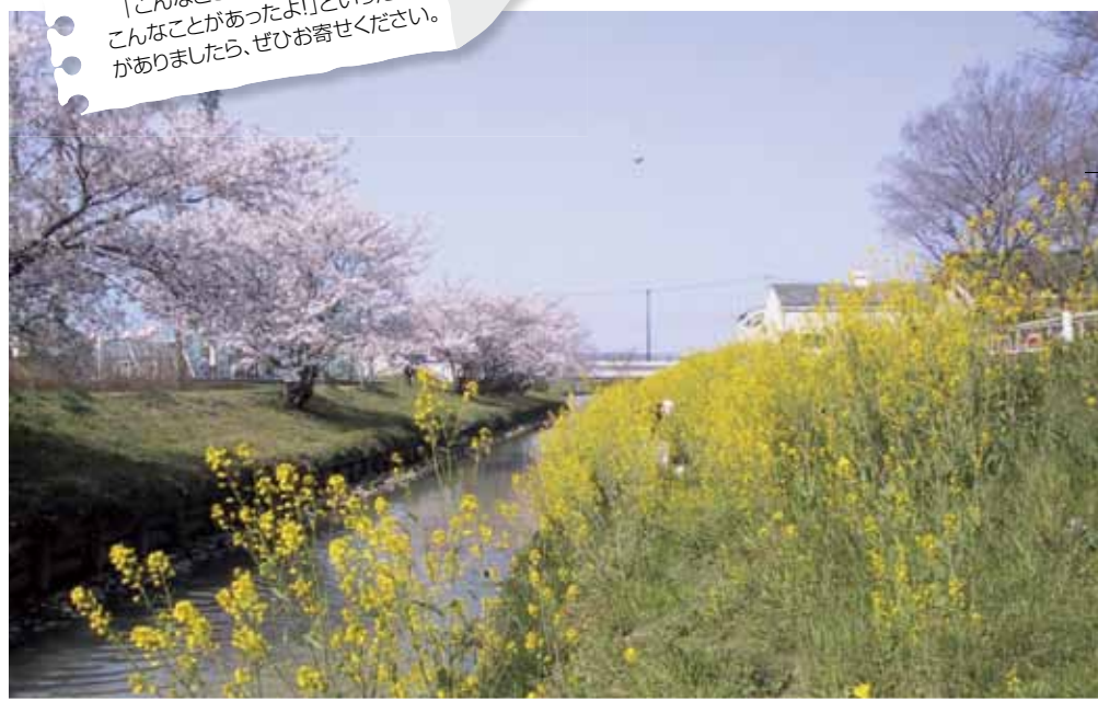
▲拡幅工事以前の稗田川（平成8年ごろ）

「こんなことを知っている!!」「他にもこんなことがあったよ!」といった情報がありましたら、ぜひお寄せください。