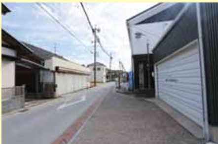
▲現在の吉浜ふれあいプラザ付近

吉浜ふれあいプラザ東側の、吉浜の上と下を南北に貫く道路は、かつて数多くの商店が立ちならび、人びとは「吉浜銀座」と呼んでいました。昭和34年まではまだ未舗装で、現在の吉浜ふれあいプラザ北側には、道路を補修するための砂利置き場があったそうです。 また、プラザができる前この場所は公民館や消防団第3分団の詰所として使っており、立派な火の見櫓も建っていました。最上段には半鐘やサイレンが設置され、吉浜のまち並みが一望できたため、地区内のどこかで火災が発生しているのがひと目でわかるようになっていました。 (T.M)