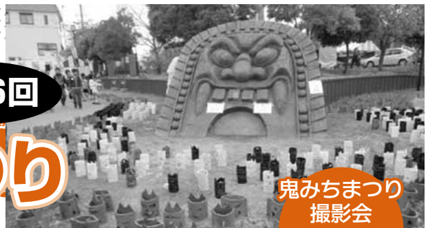
鬼みちまつり 撮影会

鬼みちの沿道に鬼あかり（瓦製ランプシェード、ペットボトル製ランプ）が飾られ、幽玄な雰囲気の中を散策することができます。地元グルメの出店やチャラポコ踊りなどもお楽しみください。