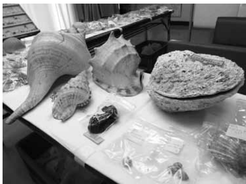
▲南部第2ふれあいプラザで展示された貝