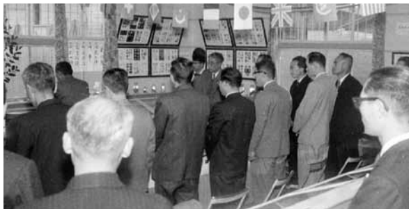
▲「貝の博物館」オープン時のようす