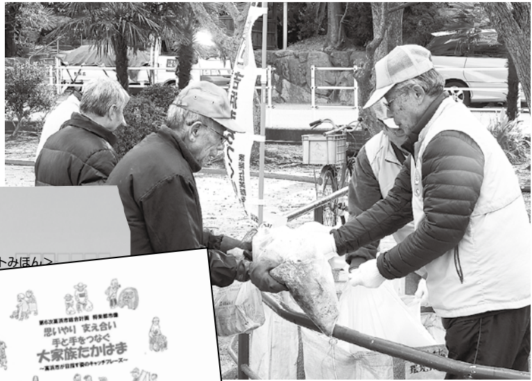
<市民意識調査アンケートみほん>