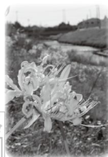
▲稗田川沿い彼岸花