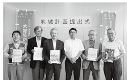
▲地域計画提出式にて