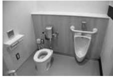
◀子どもトイレができました

各窓口への適切な案内、各種証明書に関する手続きの集約など、より利便性の高いサービスを提供するために、新たに2つの窓口を設置します。詳しくは、『広報たかはま』12月15日号でお知らせします。