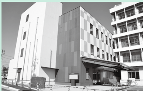
南側来庁者出入口

第2期工事中は、来庁者出入口は、南側の出入口のみとなりますので注意してください。また、庁舎前の駐車可能台数が少なくなりますので、臨時駐車場(P2地図参照)の利用をお願いします。ご迷惑をおかけしますが、理解と協力をお願いします。