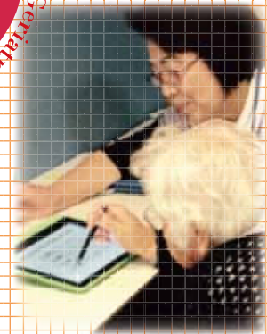
予防・対策のために まずは、自分の状態を知ることが 大切です！ 【認知症予防スタッフ】

参加者にはもれなく 健康づくりに役立つ 「活動量計」をお渡しします！ 【市保健師】