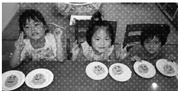
2014キングカワラッキー賞受賞者 アラ40ママとアラ4キッズ