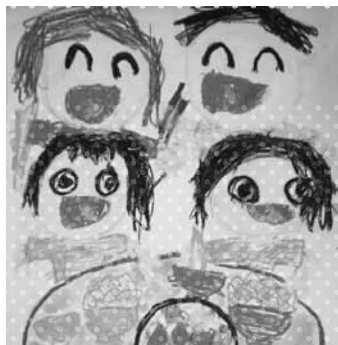
2014 ベストカワラッキー賞 受賞作品

応募方法 9月1日(火)に作品の裏面に応募用紙(幼稚園・保育園部門用)を貼って園へ提出