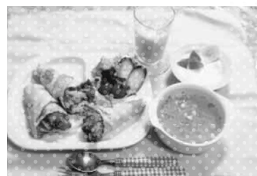
2014 ベストフレンズ賞 受賞作品