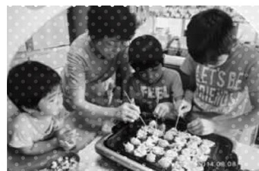
2014 ベストカワラッキー賞 受賞作品