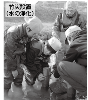
竹炭設置(水の浄化)