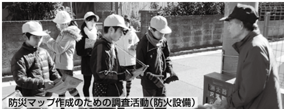
防災マップ作成のための調査活動(防火設備)

今まで気づけなかった消火栓や消火器の場所。まち中には、地域の安全を守るための備えができていないことに気づいた子どもたち