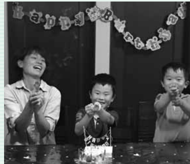
「皆んな笑顔の誕生会」

...nice pictures. Your smile 平成28年度応募作品より