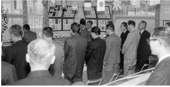
▲「貝の博物館」オープン時のようす