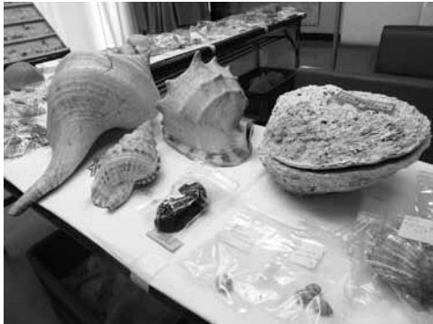
▲南部第2ふれあいプラザで展示された貝