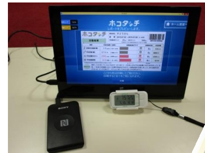
▲活動量計とホコタッチ